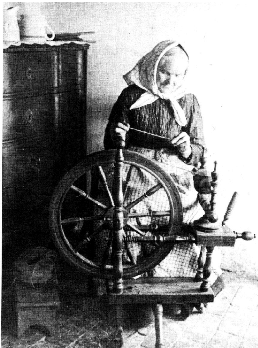
Fig. 2. Vi ved ikke, hvordan der har set ud hos spinderskerne i Sønder Har-ritslev i midten af 1800-årene. For i det mindste at give en fornemmelse af en spindesituation vises her et fotografi fra begyndelsen af 1900-årene af en spindende kvinde, der dog har siddet i noget bedre kår end kvinderne i Sønder Harritslev 50 år tidligere. Billedet er fra Tornby.